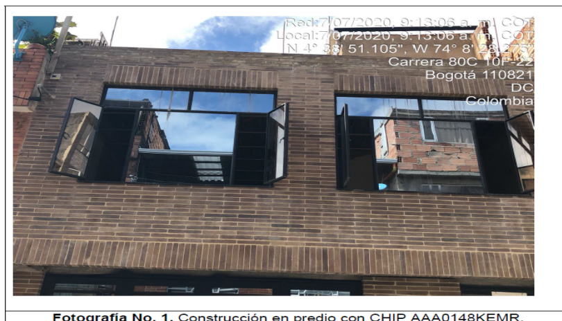
Fotografía No. 1. Construcción en predio con CHIP AAA0148KEMR.